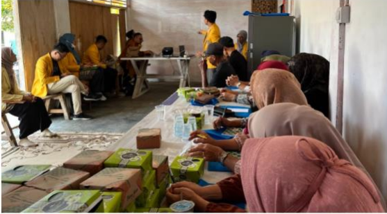
Gambar 1. Sosialisasi dan Pemberian Materi berkaitan dengan Pupuk Organik Cair

menggunakan alternatif pupuk organik untuk mengurangi ketergantungan petani terhadap kebutuhan pupuk kimia.