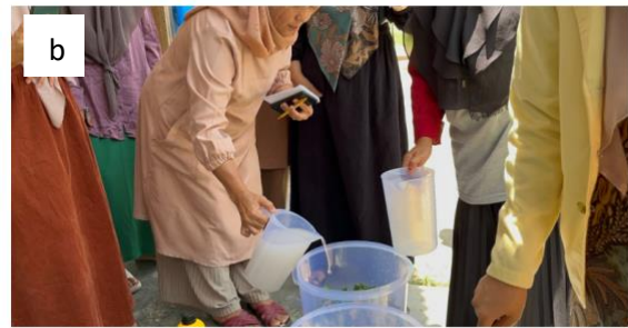
Gambar 2. Proses pembuatan Pupuk Organik Cair (a) Pemotongan limbah sayuran (b) Pencampuran bahan bahan kedalam wadah fermentasi

Selama praktik berlangsung, mahasiswa terlibat dalam membantu serta memastikan proses dilakukan dengan benar bersama dengan peserta kegiatan pelatihan pembuatan POC yang lainnya. Peserta diajak berdiskusi untuk mengaitkan dengan kondisi lingkungan mereka, seperti ketersediaan limbah organik yang bisa digunakan secara berkelanjutan serta pengolahan serta aplikasi POC dalam bidang pertanian.