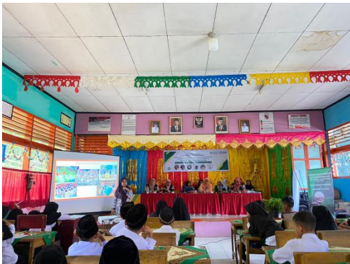
Gambar 2. Edukasi Pengelolaan Sampah Anorganik pada Siswa SD Nagari Tanjung Balik

Kegiatan PKM diawali dengan edukasi pengelolaan sampah anorganik yang kepada siswa (Gambar 2). Pada kegiatan ini siswa diberikan pemahaman terlebih dahulu untuk mengenal jenis-jenis sampah yaitu sampah organik dan anorganik berdasarkan asal dan karakteristik dari sampah tersebut. Dengan demikian, siswa mampu mengidentifikasi dan mengelompokkan contoh-contoh sampah organik dan anorganik yang ditemui di lingkungan sekitarnya.