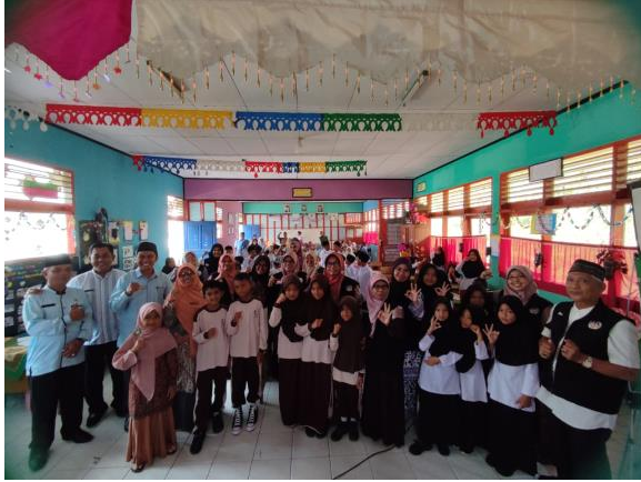
Gambar 1. Edukasi Pengelolaan Sampah di Nagari Tanjung Balik

Pengabdian Kepada Masyarakat (PKM) telah dilaksanakan pada 15 September 2023 (Gambar 1).