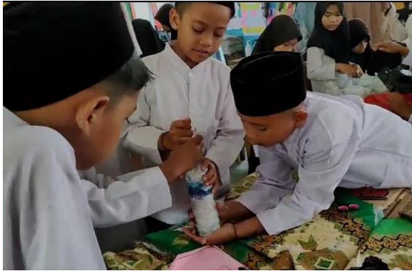
Gambar 4. Siswa Membuat Ecobrick

Pemberian edukasi pengelolaan sampah kepada siswa mampu meningkatkan pengetahuan siswa dalam mengidentifikasi dan mengelompokkan sampah berdasarkan ciri-ciri dan karakteristiknya, serta menambah kesadaran siswa dalam upaya pengelolaan sampah anorganik. Hal ini terlihat dari hasil pretest dan posttest yang diberikan sebelum dan setelah penyampaian materi edukasi pengelolaan sampah anorganik sebagaimana ditampilkan pada Gambar 5.