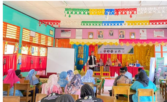
Gambar 6. Edukasi Pengelolaan Sampah Organik

dan pengelola Bank Sampah Ka Saro juga diberikan edukasi mengenai pengelolaan sampah organik menjadi pupuk organik yang dapat memicu pertumbuhan tanaman. Pada edukasi ini, para guru dan anggota Bank Sampah Ka Saro diajarkan untuk membuat pupuk organik dari sampah hasil kulit buah, yakni buah pisang yang telah dikonsumsi pada saat makan siang (Gambar 6).