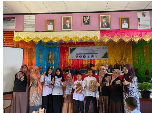
Gambar 3. Penyerahan Reward

Agar saat penyampaian materi siswa tidak merasa bosan dan jenuh, maka diberikan beberapa games yang berkaitan dengan materi. Untuk siswa yang memenangkan games dan yang ikut aktif bertanya dan menjawab pertanyaan dengan benar diberikan reward berupa hadiah (Gambar 3). Pemberian reward ini bertujuan agar siswa lebih bersemangat dan termotivasi dalam mengikuti kegiatan.