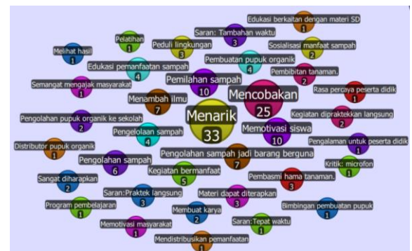
Gambar 7. Hasil Analisis Kuisioner dari Guru SD Nagari Tanjung Balik dan Pengelola Bank Sampah Ka Saro

Para guru dan pengelola Bank Sampah Ka Saro juga diberikan sampel hasil pupuk organik yang telah siap pakai. Di akhir materi, para peserta diminta untuk mengisi kuisioner mengenai kegiatan yang telah dilakukan. Hasil kuisioner yang diberikan dianalisis menggunakan aplikasi Quirkos yang ditampilkan pada Gambar 7.