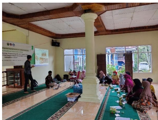
Gambar 1. Pelatihan Dasar Tentang Pupuk Organik

Analisis awal dilaksanakan terhadap 27 orang anggota kelompok tani Buah Sakato melalui angket yang disebar sebelum pelatihan dasar tentang pupuk organik dilaksanakan (Gambar 1). Melalui observasi, diperoleh hasil analisis awal terkait pengetahuan mitra terkait pemanfaatan jerami, dan pembuatan pupuk organik seperti yang terlihat pada Tabel 1.