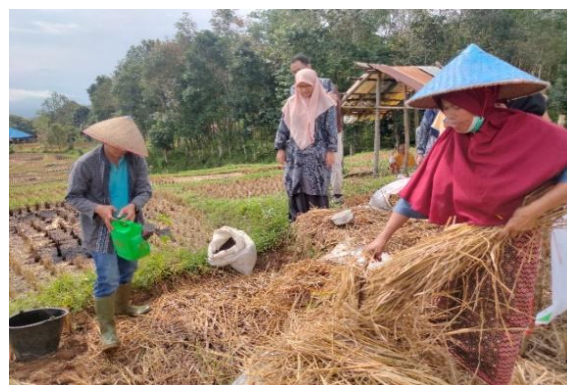
Gambar 2. Pengolahan jerami menjadi pupuk oleh anggota kelompok tani Tuah Sakato

Selanjutnya peserta pelatihan melakukan pengolahan jerami padi menjadi pupuk organik yang dipandu oleh tim pengabdian.