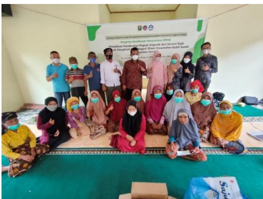
Gambar 4. Penutupan pelatihan pembuatan pupuk organik dari jerami padi

Walaupun kadar N, P dan K belum cukup tinggi yang terkandung pada pupuk organic hasil fermentasi. Namun pengolahan ini cukup membantu petani dalam menanggulangi limbah jerami padi dan mengatasi kelangkaan pupuk.